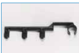
Filmbügel X-3 für alle Kleinformat

Sehr leistungsstarkes Heizungsgebläse für rasche und effiziente Trocknung der Filme