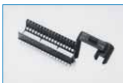
Status-Entwickler- korb X-3 für bis zu 18 Filme (2 x 3 cm und 3 x 4 cm)